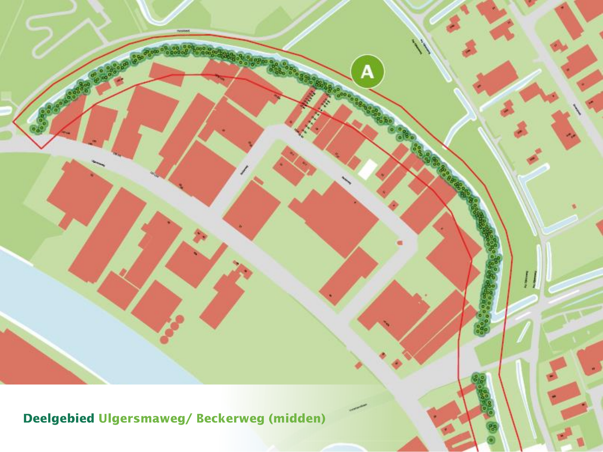
Deelgebied Ulgersmaweg/ Beckerweg (midden)