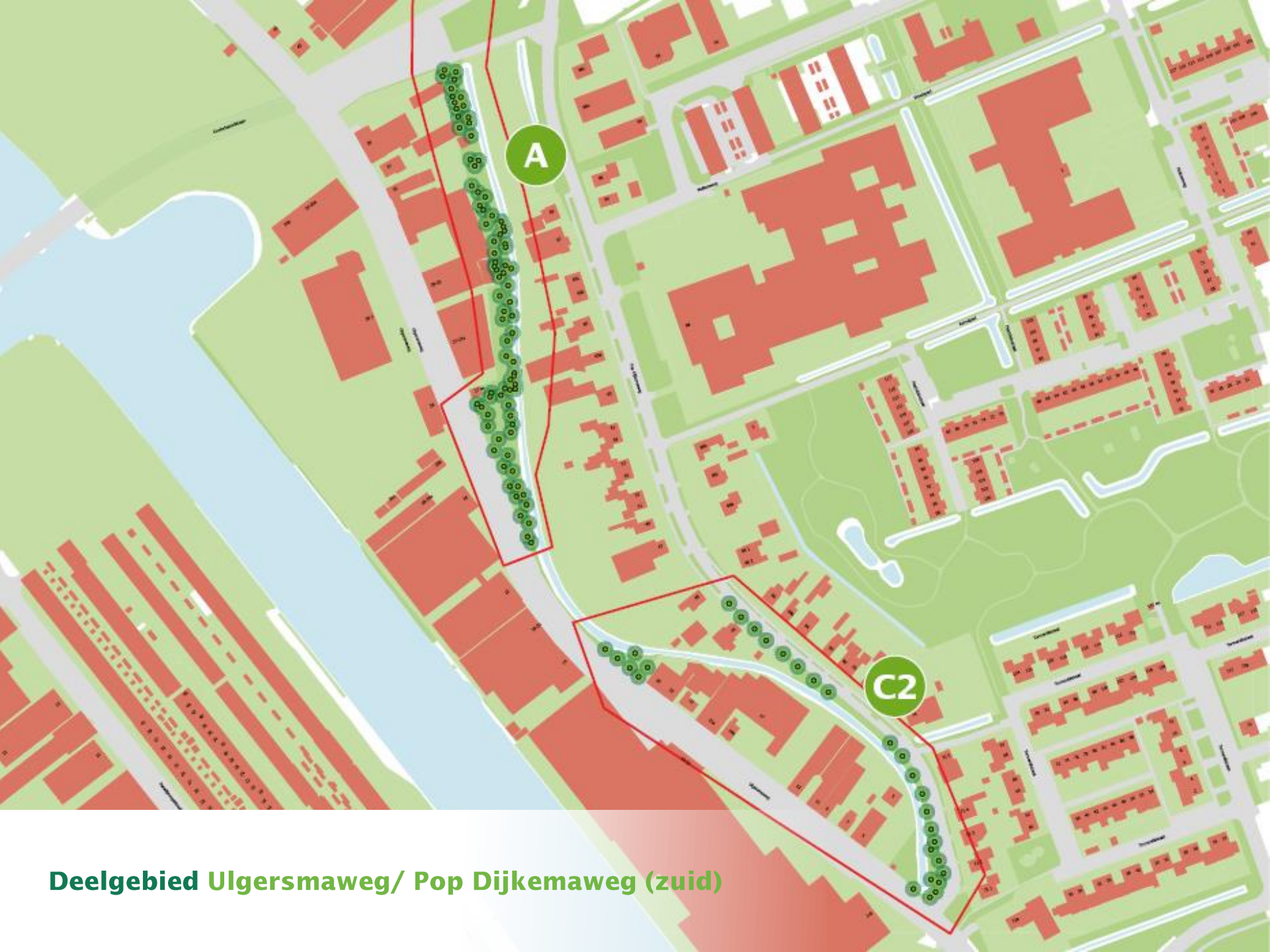
Deelgebied Ulgersmaweg/ Pop Dijkemaweg (zuid)